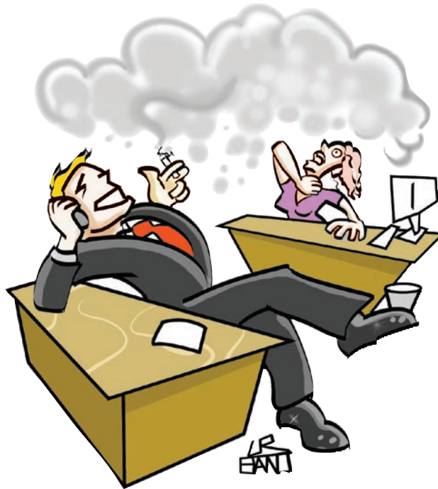
Figura 13.2: Na figura, a mulher é uma fumante passiva por estar exposta à fumaça do cigarro de seu colega de trabalho.

O tabagismo é reconhecido pela OMS como uma dependência de ordem fisiológica, psicológica, genética, comportamental e até mesmo social dos fumantes.